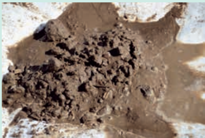
Boden stark verteilt, bedeutet weniger wasserbeständige Krümel.