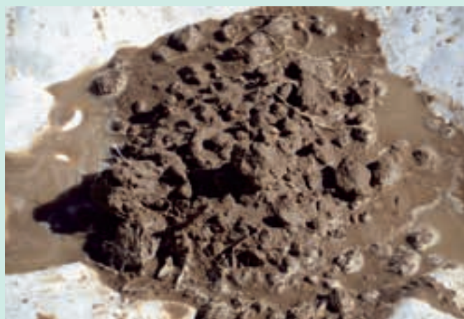
Boden in etwa in der Form geblieben, bedeutet gute Bodenstruktur.