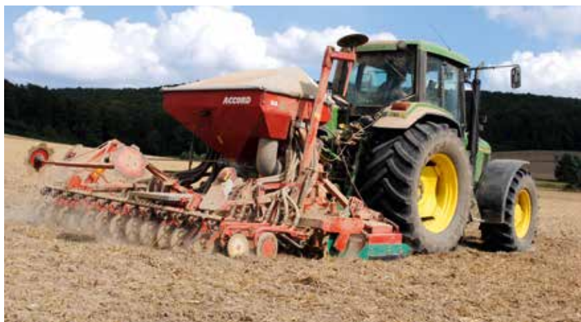
Der Einsatz der Drille in eine Mulchauflage bietet der Bodenoberfläche vorläufigen Schutz vor Erosion und Austrocknung.