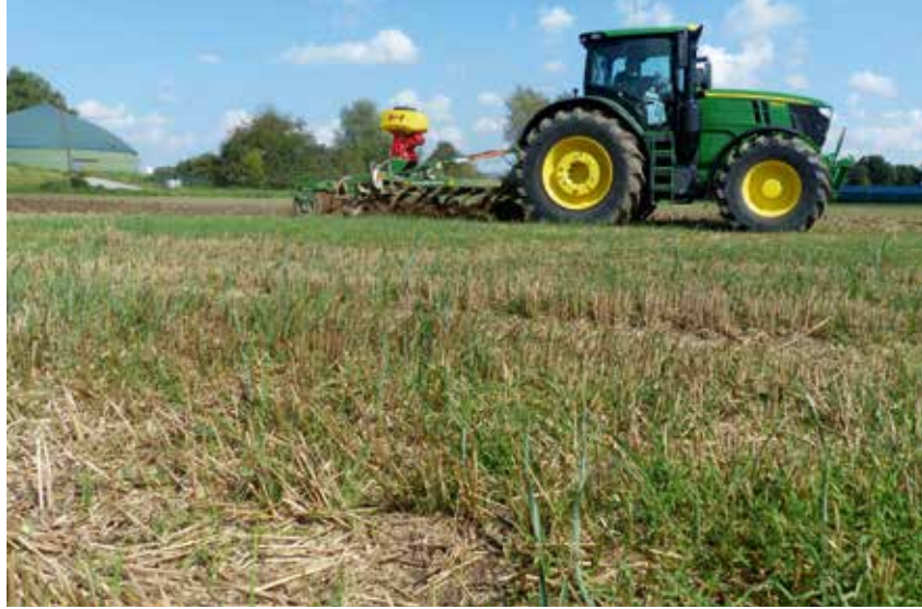
Ein Pneumatikstreuer auf dem Bodenbearbeitungsgerät lässt zwei Arbeitsgänge kombinieren.